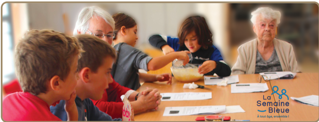
Le C.C.A.S. a proposé aux seniors divers ateliers pour leur bien-être dans le cadre de la Semaine Bleue organisée pour la 1 ère fois à Beynes

➔ Conseil juridique, le 26 entre 9h et 12h, à la Mairie Annexe Sur rendez-vous uniquement au 06 63 33 28 60.