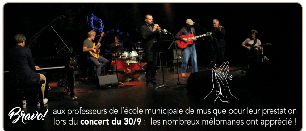
aux professeurs de l'école municipale de musique pour leur prestation lors du concert du 30/9 : les nombreux mélomanes ont apprécié !

COÛT € voirie (stationnement et chemin piétons) 47 500 € T.T.C. et éclairage public 34 200 € T.T.C.