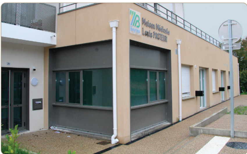
Route de Frileuse