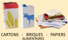
CARTONS - BRIQUES ALIMENTAIRES - PAPIERS