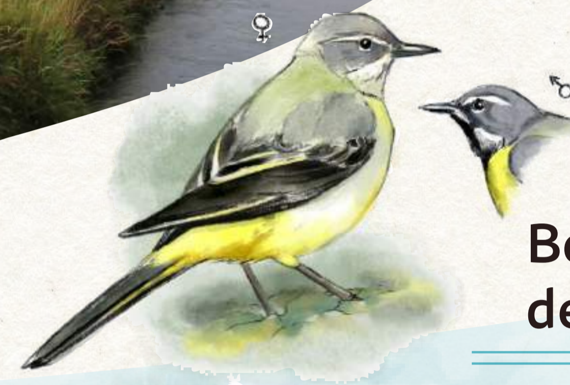
Bergeronnette des ruisseaux