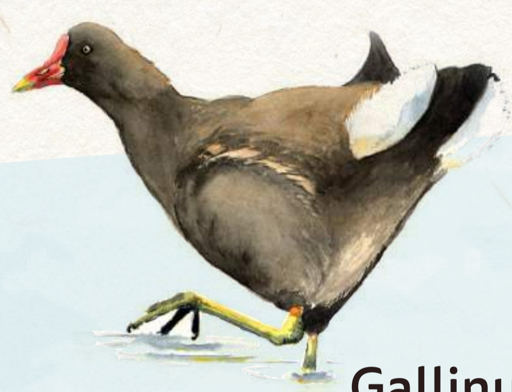
Gallinule poule d'eau