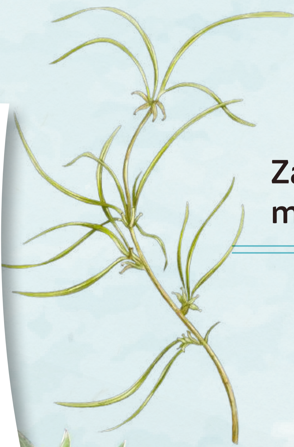
Zanichellie des marais

Sur les berges de la Mauldre poussent ponctuellement des espèces caractéristiques de milieux humides comme le Saule blanc, le Frêne commun et certaines espèces herbacées remarquables comme la Zanichellie des marais.