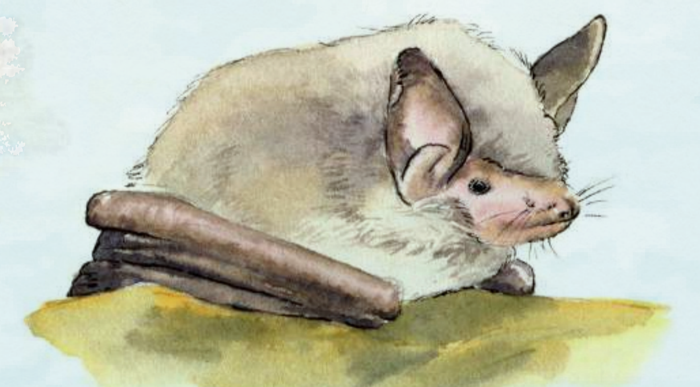
Murin de Daubenton

Les chauves-souris trouvent dans ce milieu des espaces ouverts pour chasser et des arbres pour gîter. Le Murin de Daubenton peut pêcher des petits poissons qui frôlent la surface de l'eau.