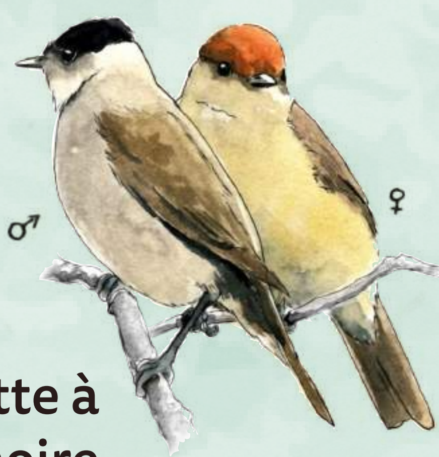
Fauvette à tête noire