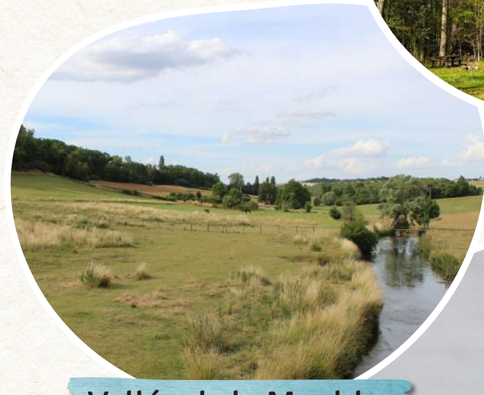
Vallée de la Mauldre