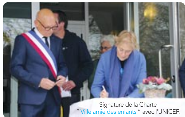
Signature de la Charte " Ville amie des enfants " avec l'UNICEF.

Décloisonner et établir des passerelles dans tous les domaines de l'éducation comme le fait la mairie de Beynes garantit un parcours éducatif cohérent à notre jeunesse.