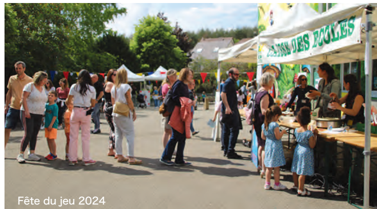
Fête du jeu 2024

Réservation conseillée au 01 34 89 14 36 / bibliotheque@beynes.fr