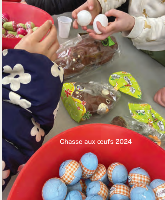
Chasse aux œufs 2024