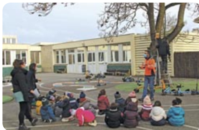
Les Services Techniques installent les nichoirs dans les écoles

Si vous rencontrez un problème de distribution du Beynes Actu Contactez le Service Communication au 09 78 04 53 53.