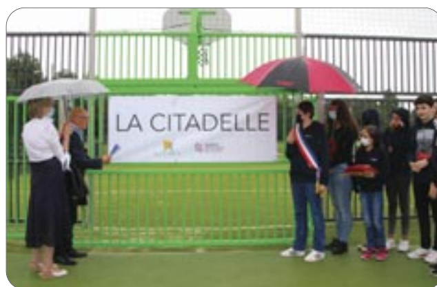
Inauguration de l'aire multisports, le samedi 11 juillet 2021

Si vous rencontrez un problème de distribution du Beynes Actu Contactez le Service Communication au 09 78 04 53 53.