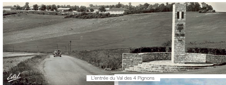
L'entrée du Val des 4 Pignons