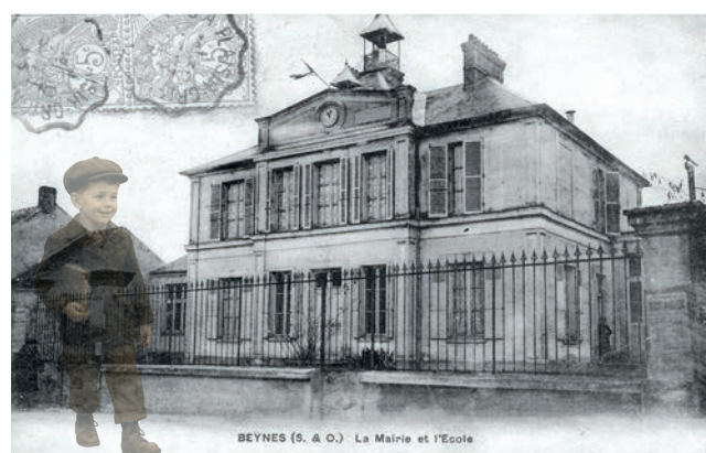
Evolution de la Mairie devenue l'Ecole Anatole France