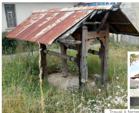
Travail à ferrier