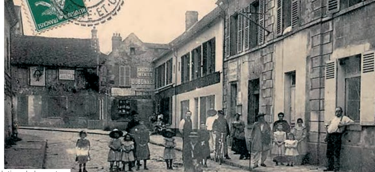
Evolution de la poste